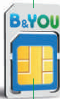
Micro carte SIM