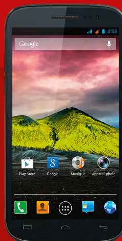
DAS : 0,639 W/Kg